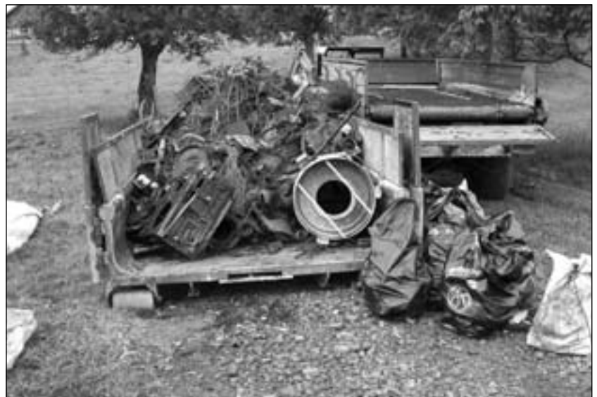
Vor und nach der Sanierung des Gouffre de la Barigue.

Möglichkeiten – auch die im allgemeinen am Schachtboden vorhandene Erde herauszuschaffen, denn darin haben sich die aus dem Abfall ausgeschwemmten Schwermetalle angereichert.