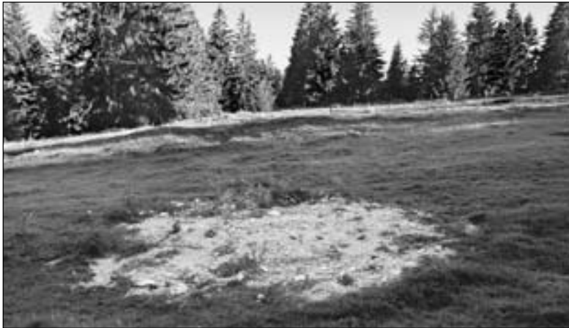
Eine Doline, «Opfer» einer illegalen Verfüllung in der Umgebung von La Chaux-de-Fonds; ein Fall unter vielen.

die Reaktionen bei den Behörden, denen die Situation bislang unbekannt war, positiv ausfielen, ist es leider noch zu früh um sagen zu können, ob auch wirklich etwas unternommen wird. Es ist aber auch klar, dass die Früchte einer solchen Aktion nicht von heute auf morgen reifen, man muss abwarten. Es wurde uns auch durch die Kontakte zu den betroffenen Beamten klar, dass die Gesetze im Bezug auf den Schutz der Dolinen (und auf andere Karstobjekte) Mängel aufweisen. Die Ablagerung von Abfällen ist auf Grund verschiedener Gesetze (USG, GSchG, TVA, usw.) eindeutig verboten, eine Grauzone bleibt aber bestehen, wenn Dolinen aufgeschüttet werden (laut Gesetz sind Dolinen «grundsätzlich» ges-