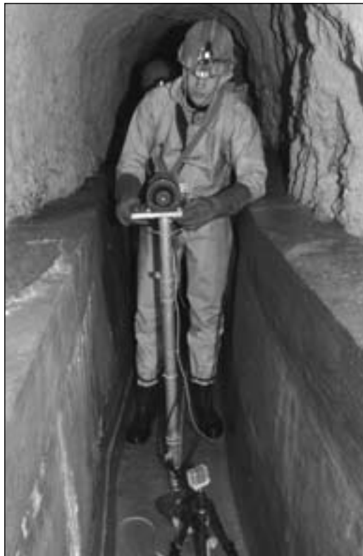
Der 2D-Scanner bei Messungen im Tunnel der Corbatière.

versprechend. In grösseren Gängen oder Sälen ist der 3D-Laser effizienter und auch viel präziser. Heute ist unsere Technik besonders gut für die geometrische Erfassung von Minen, Fassungs- und Leitungsstollen geeignet.