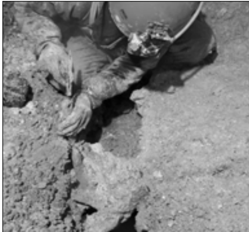
Derselbe Schädel nach der Reinigung.