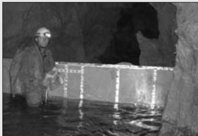
Einer der Ölabscheider, der am Lauf des unterirdischen Flusses in der Milandre-Höhle installiert wurde.

Wir möchten auch unsere Kontakte zu Russland, Kuba und der Türkei erwähnen, die längerfristig zu konkreter Zusammenarbeit im jeweiligen Land führen könnten.